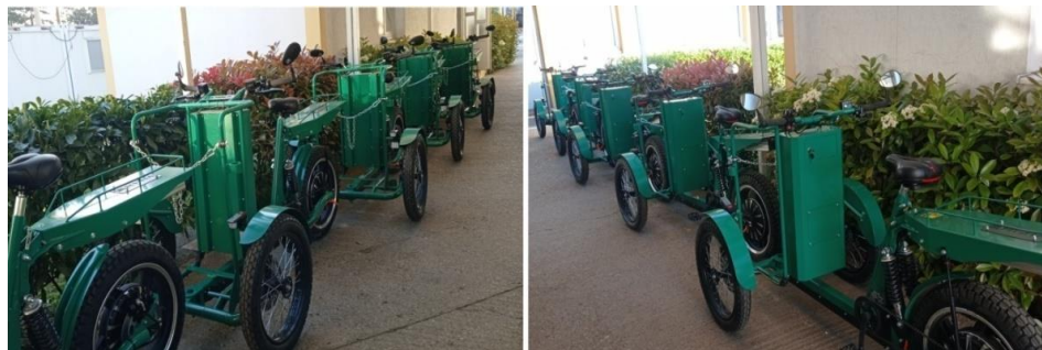
Električna teretna trokolica