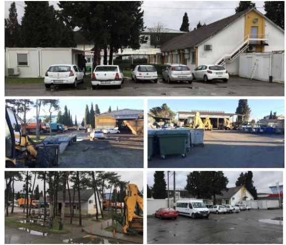
Postojeće stanje upravne zgrade sa pratećim objektima

Tokom 2022. godine urađeno je Idejno rješenje novog kompleksa, za koje je dobijena Saglasnost Glavnog gradskog arhitekta. Takođe, sprovedene su tehničke radnje koje se odnose na geodetsko snimanje lokacije, kao i prikupljanje tehničke dokumentacije, neophodne za stvaranje uslova za izradu Glavnog projekta i početka izvođenja radova na ovom lokalitetu.