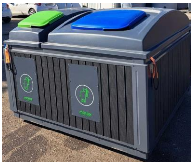
Nadzemni kontejner od 2m 3