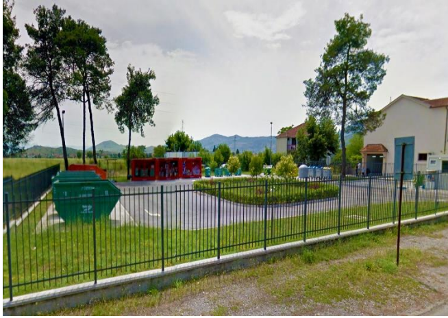
Slika 1. Reciklažno dvorište