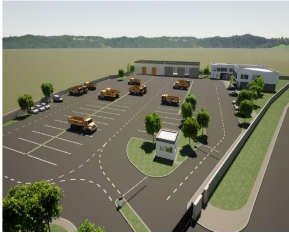
Digitalni prikaz novog kompleksa