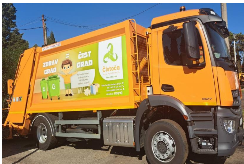
Autosmečar 16 m 3

Planirano širenje urbanih prostora i zahvatanje preostalih ruralnih područja za odlaganje i odvoz komunalnog otpada sa područja Glavnog grada, uz već postojeće obaveze, prirodom posla, zahtijeva dodatna sredstva i opremu, a što je uslov poboljšanja rada na sakupljanju i transportu komunalnog otpada, zaštite i očuvanja zdrave životne sredine, dakle realizacije postojećih i novoformiranih obaveza tokom 2023. godine.