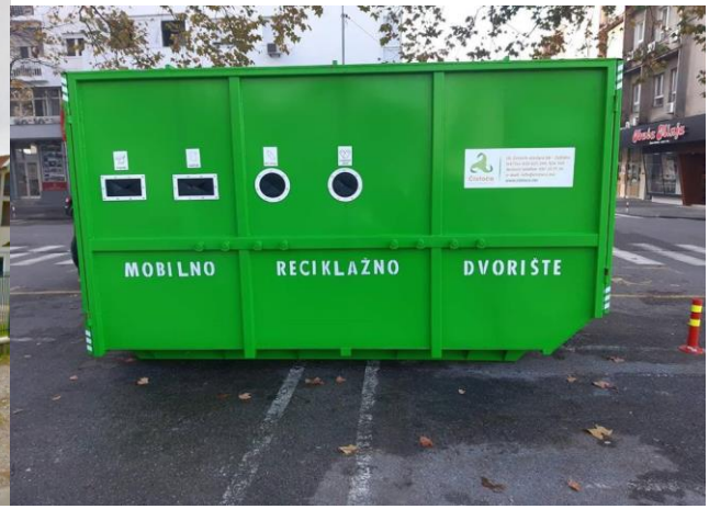
Slika 2. Mobilno reciklažno dvorište

S obzirom da su tokom ove, kao i prethodnih godina, već ostvareni određeni prihodi po osnovu plasmana sakupljenih količina prvenstveno reciklabilnih materijala, planirano je da se i tokom 2023. godine nastoji povećati nivo ovih prihoda, kako bi se u dogledno vrijeme stekli uslovi da ovi komunalni objekti budu djelimično ekonomski samoodrživi.